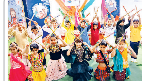
झज्जर। डांडिया नृत्य की प्रस्तुति के दौरान उपस्थित नन्हें विद्यार्थी।