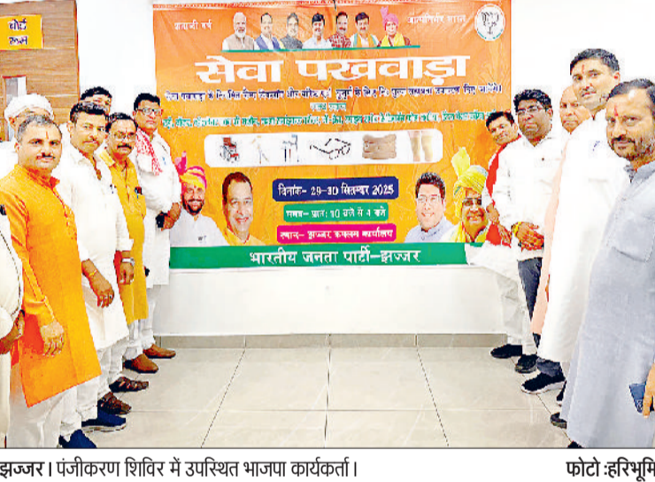
झज्जर। पंजीकरण शिविर में उपस्थित भाजपा कार्यकर्ता।