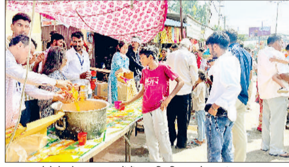
झज्जर। मेले के दौरान श्रद्धालुओं में जूस वितरित करते हुए संस्था सदस्य।

झज्जर। इंडियन फाउंडेशन, सेवा ट्रस्ट यूके इंडिया एवं विश्व हिंदू परिषद द्वारा सोमवार को मां भीमेश्वरी देवी मेले में शिव चौक पर श्रद्धालुओं के लिए जूस पिलाया गया। मां भीमेश्वरी देवी के दर्शन करने पहुंचे हजारों श्रद्धालुओं ने जूस पीकर अपनी प्यास बुझाई। इस