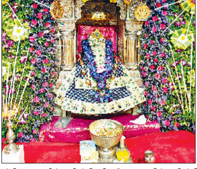
बेरी। माता भीमेश्वरी देवी की प्रतिमा, मां भीमेश्वरी देवी मंदिर में माता के दर्शनों के लिए उमड़ी लोगों की भीड़।