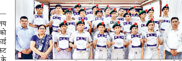
झज्जर। शिक्षकों के साथ उपस्थित ए ग्रेड सर्टिफिकेट हासिल करने वाले एनसीसी कैडेट्स।