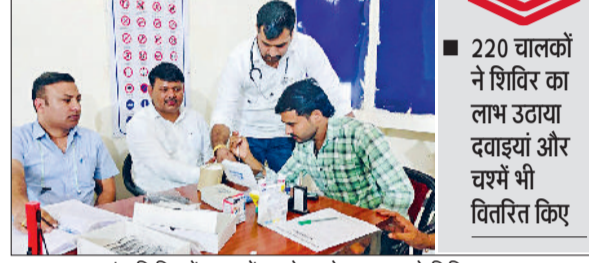
बहादुरगढ़। जांच शिविर में चालकों का हेल्थ चेकअप करते चिकित्सक।