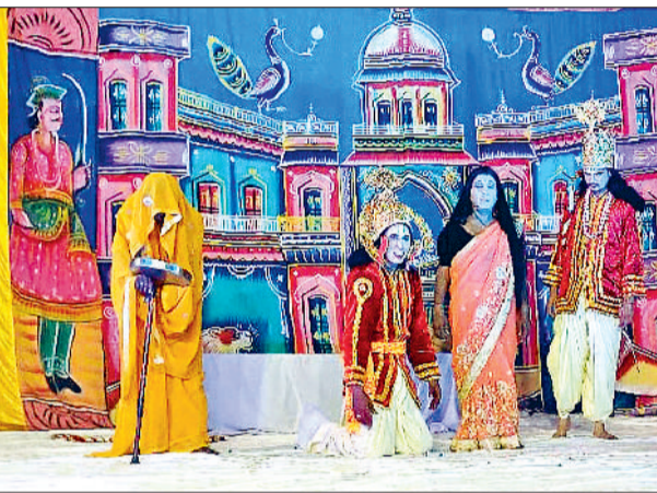
झज्जर। अयोध्या पहुंचने पर अपनी मां कैकई को पिता की मृत्यु का दोष देते हुए भरत एवं शत्रुज।

रात्रि रामलीलाओं में हुआ श्रीराम एवं भरत का मिलाप उधर, रात्रि रामलीला मंचन में भरत के निहाल से अयोध्या लौटने, पिता की मृत्यु व श्रीराम, सीता जी व लक्ष्मण के वन जाने का पता चलने पर अपनी माता कैकई को दोष देने, गुरु वशिष्ठ से परामर्श लेकर श्रीरामचंद्र जी को वन से वापिस लाने के दूथों का मंचन किया गया। भरत जब वन में अटकते हुए श्रीराम, सीता व लक्ष्मण को तलाश कर लेते हैं तो उनसे अयोध्या लौटने की बात कहते हैं। जब श्रीराम मना करते हैं तो भरत कहता है कि जब तक आप अयोध्या नहीं लौटोगे वह भी वनवासी रूप में रहेगा। इसके बाद श्रीराम उसे अपनी खंडाऊ सौंपते हैं जिन्हें लेकर भरत वापिस अयोध्या लौटता है। इस मार्मिक मंचन को देखकर दर्शक भाव विमोह उठे।