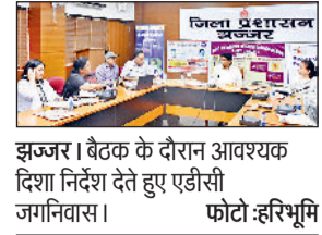
झज्जर। बैठक के दौरान आवश्यक दिशा निर्देश देते हुए एडीसी जगनवास।