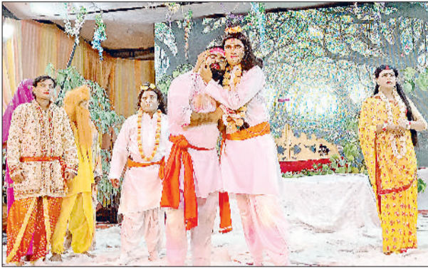
रोहताक। झज्जर। श्रीराम चंद्र जी को अयोध्या लाने के लिए वन पहुंचे भरत व सुग्रीव व बाली युद्ध में सुग्रीव को पहचाने की कोशिश करते हुए श्रीरामचंद्र जी।

बाली ने बलपूर्वक उसकी पत्नी व राज्य छीन लिया। अब वे उसके डर से इस पर्वत पर आकर रहने लगे हैं। इसके बाद जब श्रीराम जी बाली का वध करके उन्हें राजा बनाने का आश्वासन देते हैं तो सुग्रीव उनका पराक्रम जांचने के लिए एक ही बाण से ताड़ के सात वृक्षों को गिराने की बात कहता है।