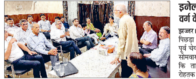
झज्जर। कार्यशाला में अपनी बात रखते हुए विषय विशेषज्ञ।

रात्रि रामलीलाओं में हुआ श्रीराम एवं भरत का मिलाप उधर, रात्रि रामलीला मंचन में भरत के निहाल से अयोध्या लौटने, पिता की मृत्यु व श्रीराम, सीता जी व लक्ष्मण के वन जाने का पता चलने पर अपनी माता कैकई को दोष देने, गुरु वशिष्ठ से परामर्श लेकर श्रीरामचंद्र जी को वन से वापिस लाने के दूथों का मंचन किया गया। भरत जब वन में अटकते हुए श्रीराम, सीता व लक्ष्मण को तलाश कर लेते हैं तो उनसे अयोध्या लौटने की बात कहते हैं। जब श्रीराम मना करते हैं तो भरत कहता है कि जब तक आप अयोध्या नहीं लौटोगे वह भी वनवासी रूप में रहेगा। इसके बाद श्रीराम उसे अपनी खंडाऊ सौंपते हैं जिन्हें लेकर भरत वापिस अयोध्या लौटता है। इस मार्मिक मंचन को देखकर दर्शक भाव विमोह उठे।