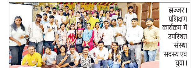
झज्जर। प्रशिक्षण कार्यक्रम में उपस्थित संस्था सदस्य एवं युवा।