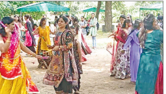
बहादुरगढ़। राजकीय महिला महाविद्यालय में डांडिया खेलती छात्राएं।