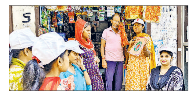
बहादुरगढ़। हार्ट हेल्थ को लेकर जागरूक करती स्वयंसेविकाएं।